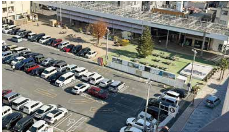
複合施設建設予定の中央駐車場

2018年4月から中心市街地2.3区に民間主導の再開発が検討され、2023年に都市計画決定。2025年度中に組合設立認可予定。2027年度から2030年度工事、中央駐車場周辺にスズラン、市立図書館、オフィスビルの複合施設建設。スズラン跡地に義務教育学校とマンションを建設し、2031年4月の竣工をめざしています。